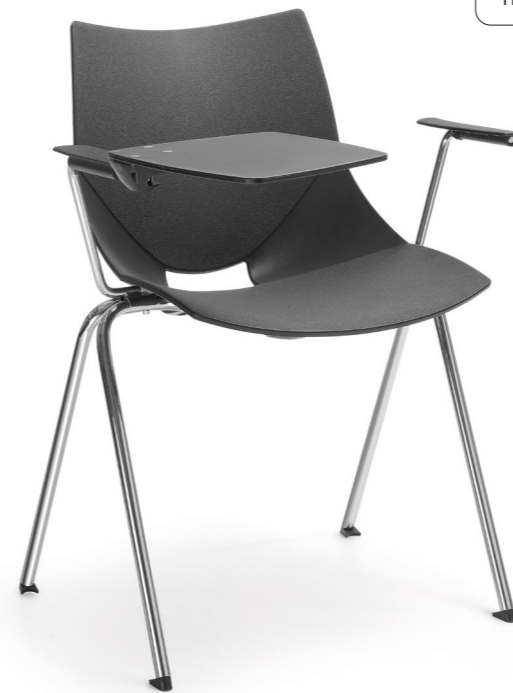
SH 220 1N P

PL | Kolory plastiku. DE | Kunststofffarben. EN | Plastic colors.