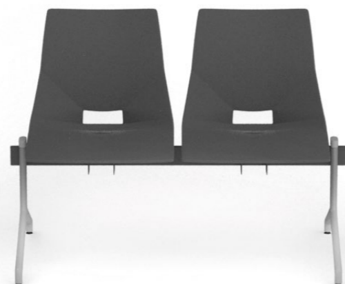
SH 222 1N

PL | 2-5 siedzisk; możliwość zamontowania blatu zamiast siedziska. DE | 2-5 Sitze; Montage einer MDF-Platte anstatt des Sitzes möglich. EN | 2-5 seats; Possibility to fix MDF desktop (instead of seat).