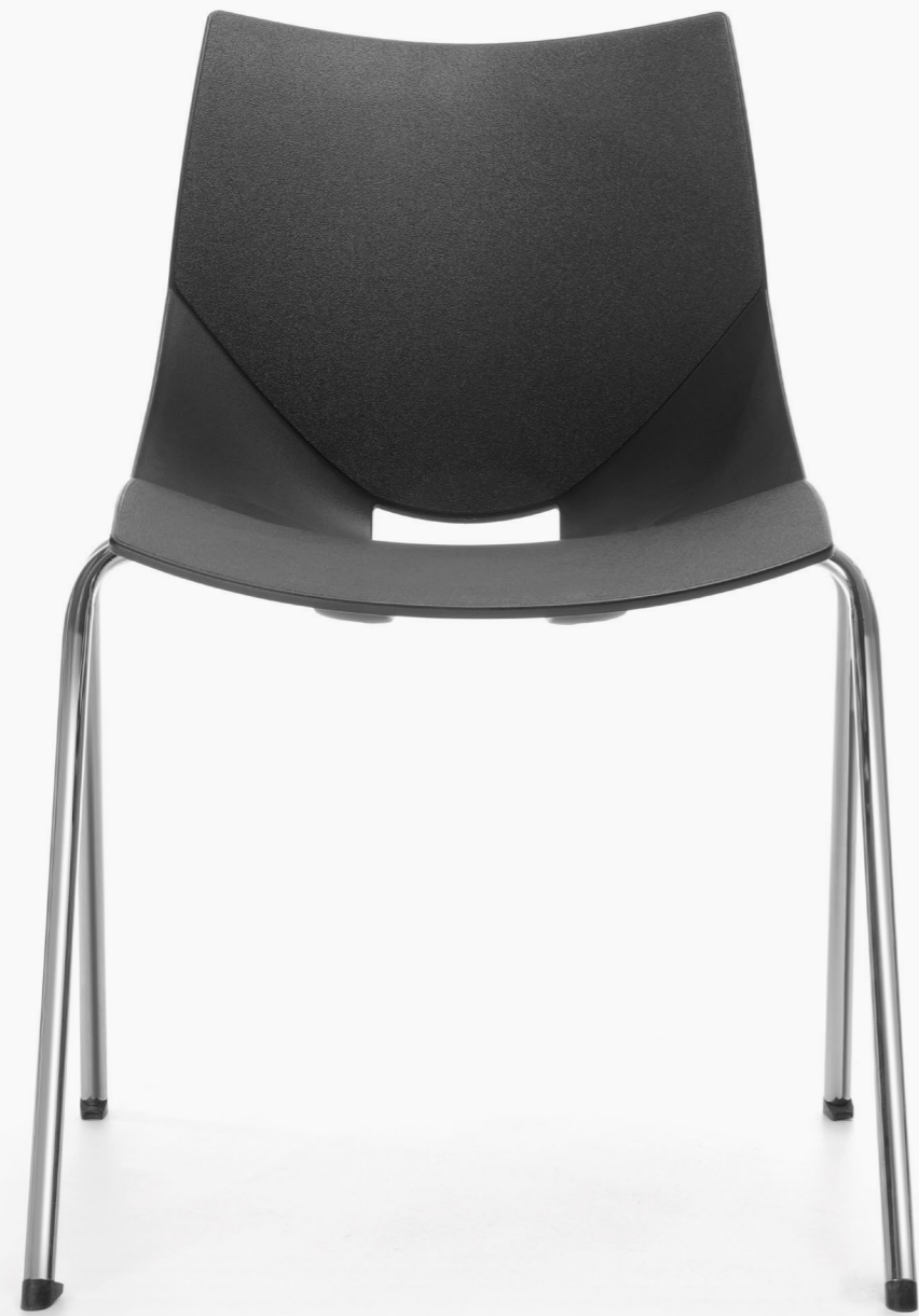
SH 215 1N