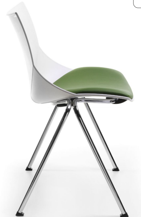
SH 215 2N