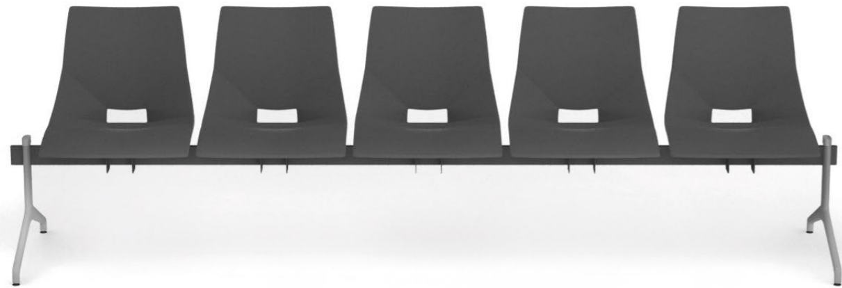
SH 225 1N