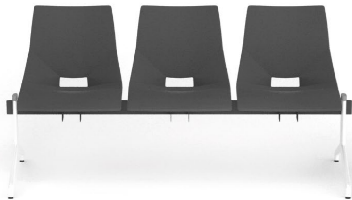
SH 223 1N